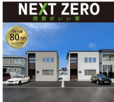
西21条南2丁目 ZEH水準 Goodnext Inc.